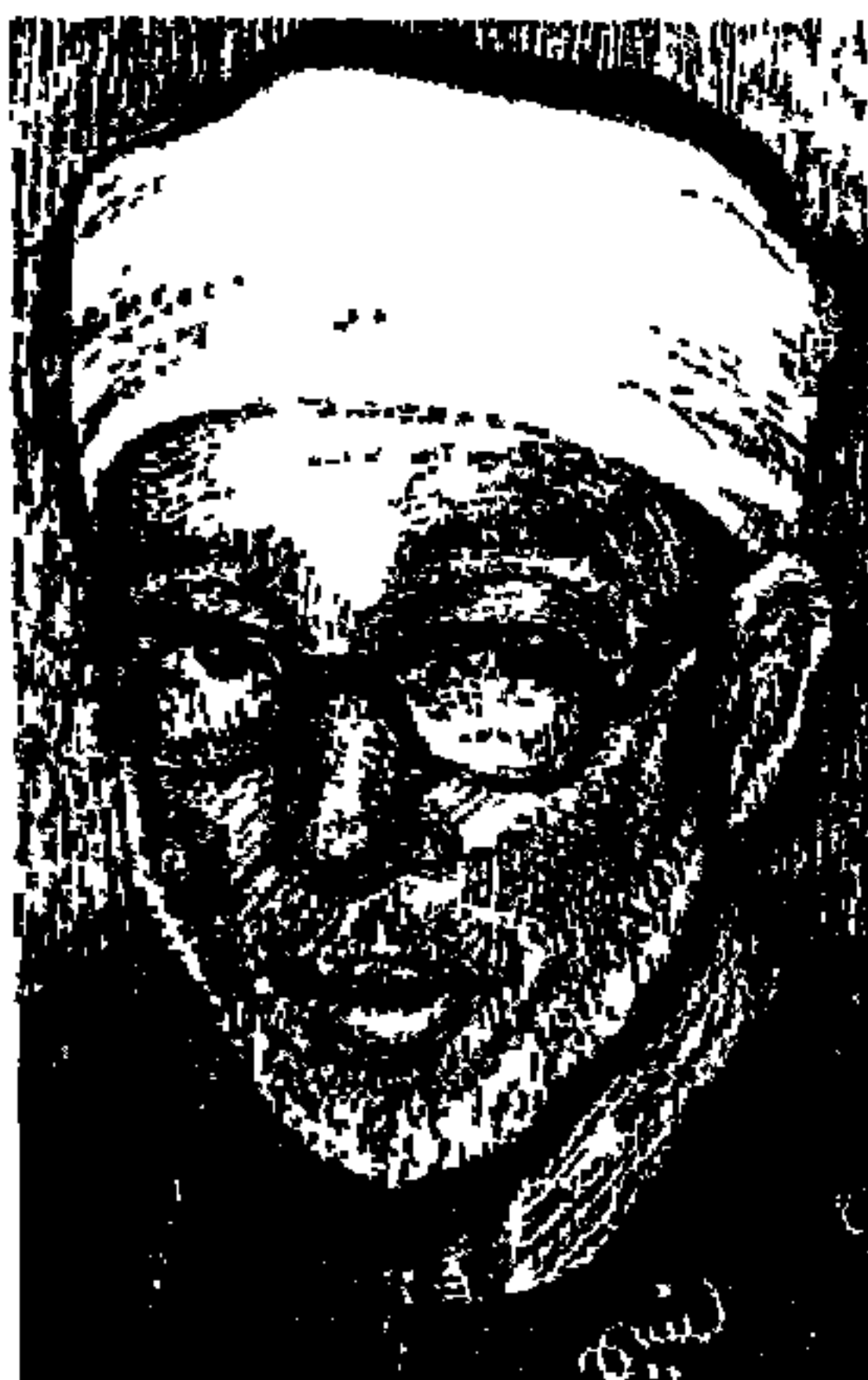
الإمام الأكبر الشيخ الدكتور: عبد الرحمن تاج

أربعة من المصريين الأوفياء ، دفعت بهم القرية المصرية إلى الأزهر الشريف ليصقلهم ويهذبهم ويملا أذهانهم بالكلام الطيب ، ثم يدفع بهم إلى الحياة العامة روادا للنهضة المصرية الحديثة ، وأوفياء إلى معهدهم العريق يردون له الجميل بالإصلاح والتطوير ورفع شأنه بين المصريين والعرب والمسلمين . .