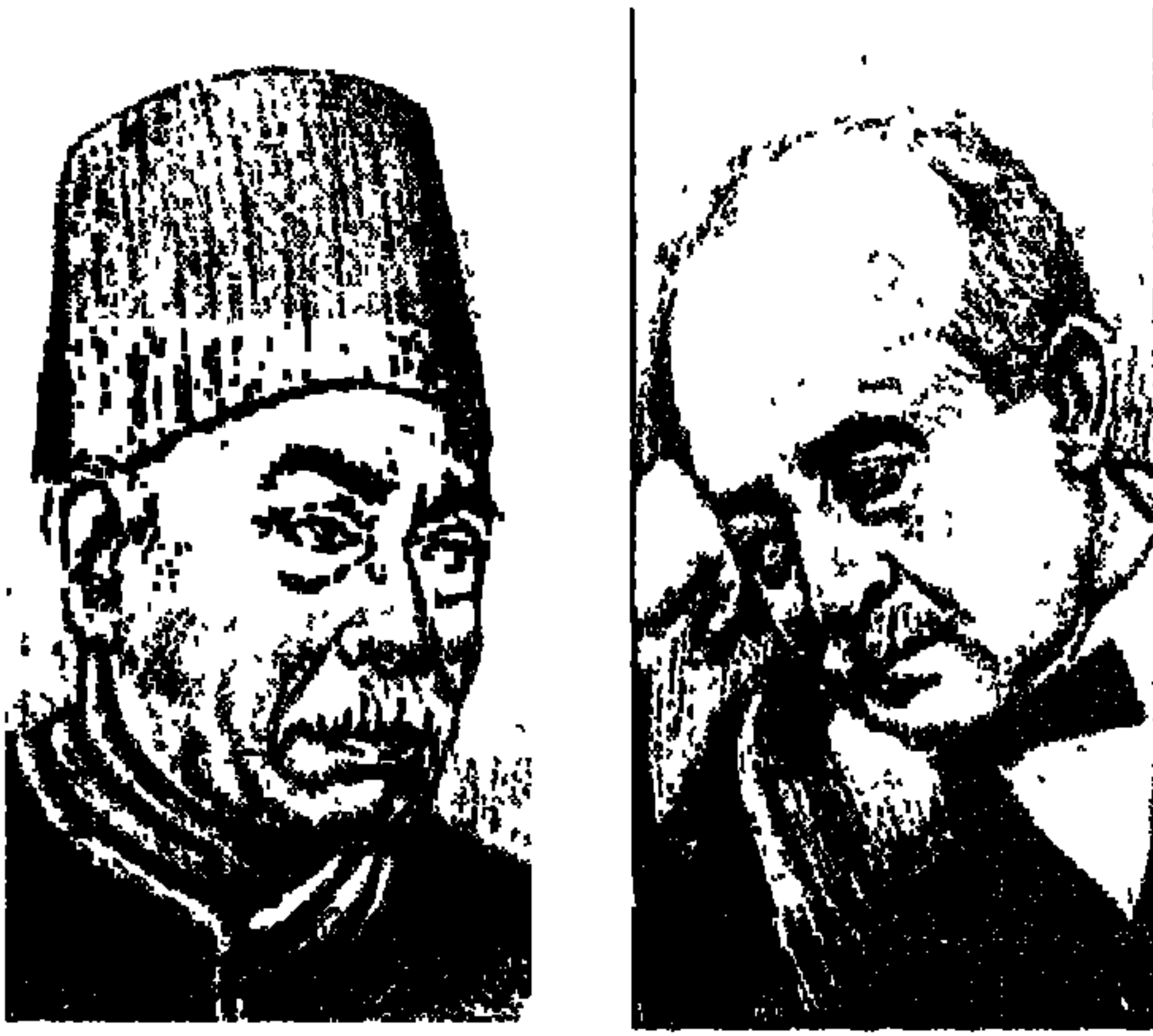
أحمد شوقي أمير الشعراء وحافظ إبراهيم شاعر النيل

كان من حسن حظ الثقافة العربية بعامة والثقافة المصرية بخاصة، هذا التلازم الودود بين أمير الشعراء أحمد شوقي وشاعر النيل حافظ إبراهيم. بارك هذا التلازم الأستاذ العميد الدكتور طه حسين في كتابه «حافظ وشوقي» وقال عنهما بأسلوبه المتميز: «لم يكن التلازم أو التقارب بين الشاعرين في سنوات الميلاد والموت وحسب، وإنما كان التلازم والتقارب بينهما في طبيعة النشاط الذهني وفي الشعر وفي اختيار ظروف مصر ليكونا صورة الوجدان الوطني، طبيعة حافظ يسيرة لا غموض فيها ولا عسر ولا التواء، طبيعة شوقي مركبة فيها أثر من العرب وأثر من الترك وأثر من الشركس.