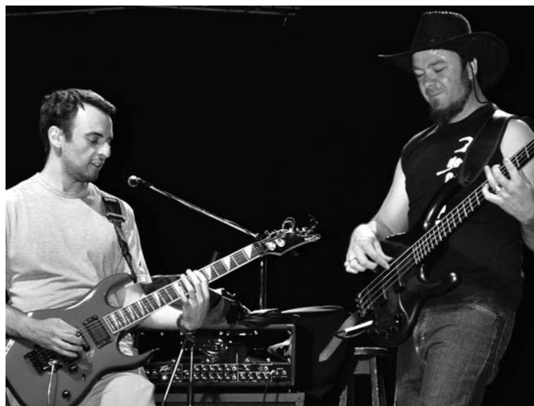
3 de Copas colaborará con el Complejo para la Discapacidad de Jesús María en el ensayo abierto previsto para el 28 de agosto.

Entre las bandas que colaborarán con su participación, ya están confirmadas "Fueguinox", "Viejo Ladrón", "Palo Vorracho", "3 de Copas" y "Tuataqui Taqui".