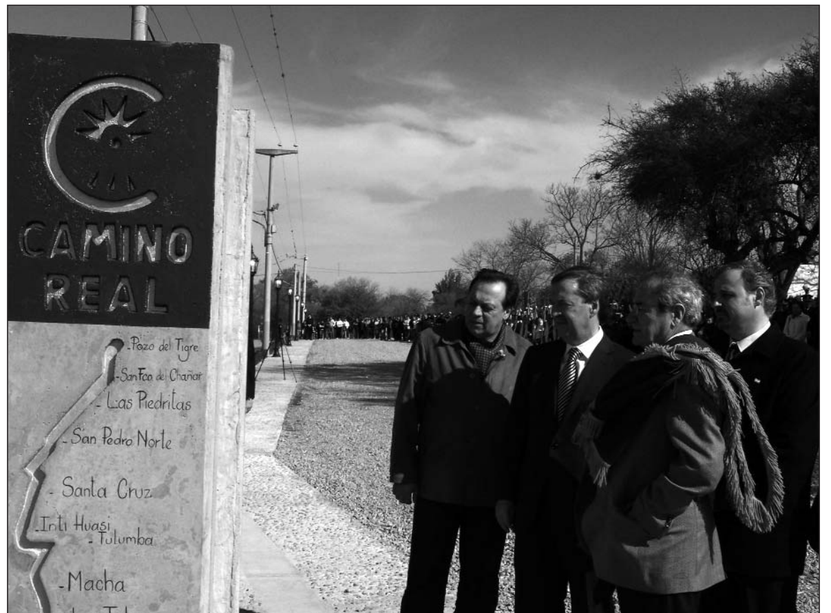
En el aniversario por el fallecimiento del libertador José de San Martín, el gobernador Juan Schiaretti dejó inauguradas las obras iniciales de puesta en valor del Camino Real al Alto Perú en Sinsacate.

El primer mandatario provincial señaló que no acotarán la