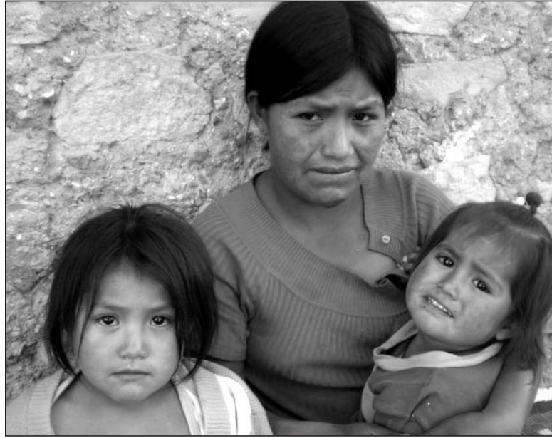
No habrá solución a la pobreza si siguen las políticas clientelistas.

Sin embargo, la lógica más elemental nos indica que, si existen "excluidos", existe un